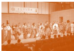
王朝装束（十二単など）モデルとして