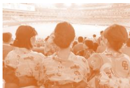
ゆかたで中日ドラゴンズを応援！