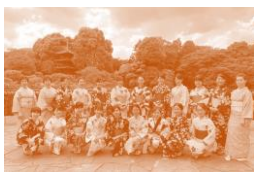
LIVING和ごころおもてなしイベントを 全国で開催