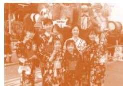
文化庁「伝統文化親子教室事業」に参加