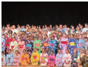
スポーツの祭典で