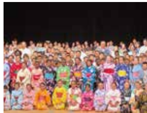
スポーツの祭典で